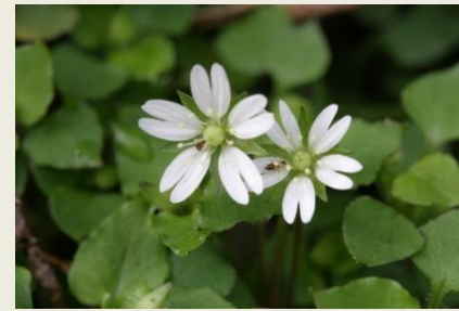
⑨ 牛はこべ (5-4-23)