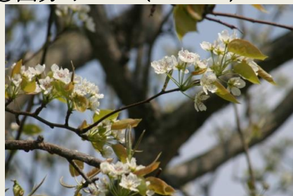
⑦ 山梨みちにく梨 (8-4-14)