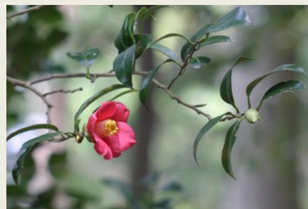
⑥ 山 椿 (10-4-14)