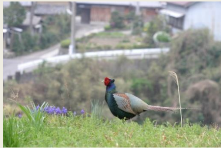
③ 雉 (きじ) (5-4-10)