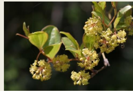
⑪ 猿とり茨 (6-4-24)