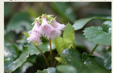
⑭ 岩 鏡 (5-4-28)