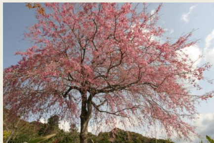
⑤ 国分寺の (10-4-14)