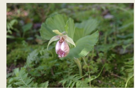
⑫ 熊谷 (くまがい) 草 (8-4-24)