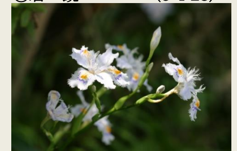
⑯ 著菘 (しやが) (12-4-29)