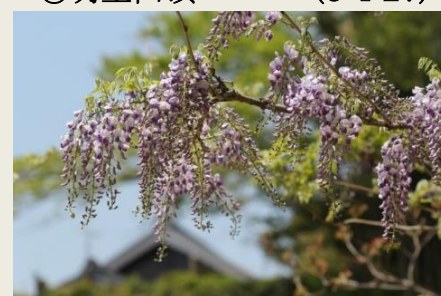
⑮ 野 藤 (13-4-29)