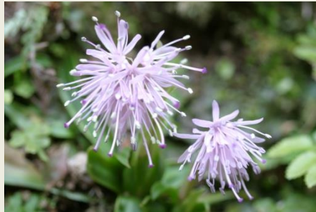
① 猩々袴 (5-4-6)