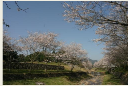
④ 前田川の桜 (4-4-10)