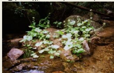
⑧ 山葵わさび (5-4-20)