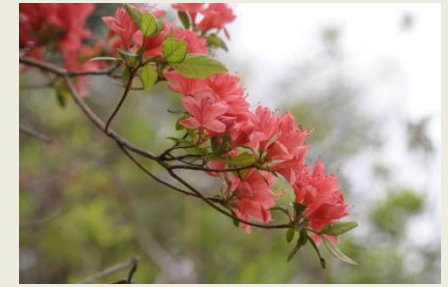
⑩ 山つつじ (13-4-23)