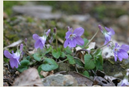
② すみれ (7-4-8)